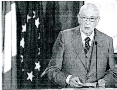
Nome Il presidente della Repubblica Giorgio Napolitano ha nominato 15 nuovi cavalieri del Lavoro

(1949) - Industria agroalimentare Ha rilevato nel 1993 piccolo complesso industriale specializzando nella produzione di pasta con il marchio Baronia a Fiumerandi (Av); distribuisce in Italia, Europa, Nord America, Giappone e Australia. Occupa 190 dipendenti ed ha un export